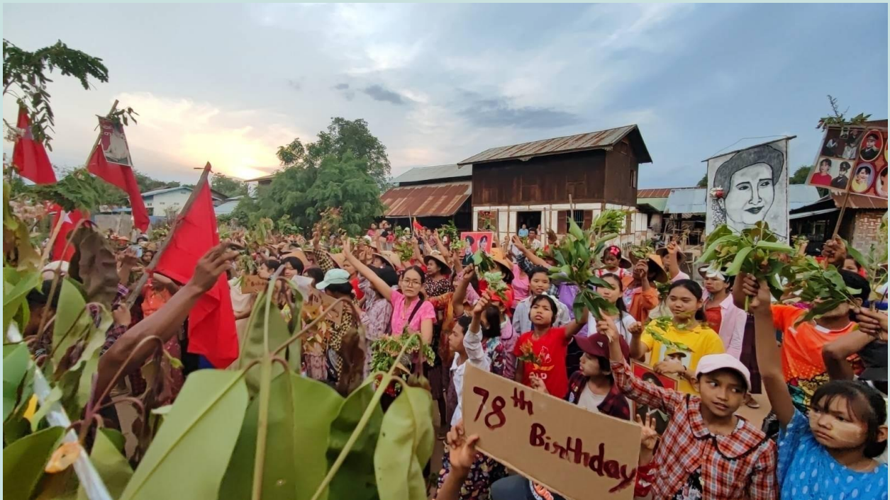
Photo 1: ဒေါ်အောင်ဆန်းစုကြည်မွေးနေ့ ပန်းသပိတ်၊ စစ်ကိုင်းတိုင်း ခင်ဦးမြို့နယ်။

၂၀၂၃ ခုနှစ် ဇွန်လ ၁၉ ရက်နေ့တွင် ကျရောက်သည့် ဒေါ်အောင်ဆန်းစုကြည်၏ မွေးနေ့ဆုတောင်းခြင်းနှင့် အတူ ပန်းသပိတ်ကို နိုင်ငံတဝန်း မြေပြင်လှုပ်ရှားမှု အပါအဝင် အွန်လိုင်းဓာတ်ပုံများဖြင့် ပါဝင်လှုပ်ရှားခဲ့ကြသည်။ စစ်ကိုင်းတိုင်း၊ ခင်ဦးမြို့နယ်မှ ရွာတစ်ရွာတွင် ဒေသခံ ၅၀၀ ကျော်စုပေါင်း၍ မွေးနေ့ဆုတောင်းပွဲနှင့် ပန်းသပိတ်ကို ပြုလုပ်ခဲ့ကြသည်။ 1