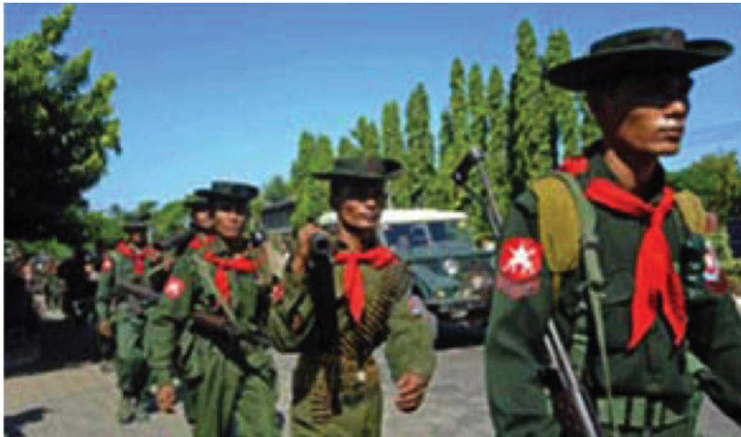
ကချင်ပြည်နယ်တွင်း မြန်မာအစိုးရ စစ်တပ်များ ပိုမိုတိုးချဲ့လာခြင်း။ ၂၀၁၃ ခုနှစ် ဧပြီလ။

“အရပ်သား” အစိုးရသစ်တက်လာချိန်မှစ၍ အမျိုးသမီးများ အဖွဲ့ချုပ် (မြန်မာနိုင်ငံ)နှင့် အဖွဲ့ဝင် အဖွဲ့အစည်းများသည် မြန်မာ့တပ်မတော်၏ လိင်ပိုင်းဆိုင်ရာအကြမ်းဖက်မှုများ ကျူးလွန်ခံခဲ့ရသော အမျိုးသမီး (၁၀၄) ဦးကို မှတ်တမ်းပြုစု နိုင်ခဲ့သည်။ ယင်းအမှုများသည် အပေါ်ယံမျှသာရှိသေးသည်။ ပြုမူဆောင်ရွက်ပုံ သဘောသဘာဝနှင့် ကျူးလွန်ပုံများသည် အဓမ္မပြုကျင့်မှုကို စစ်ပွဲနှင့် တိုင်းရင်းသား ဒေသများအတွင်း ဖိနှိပ်မှုကိရိယာအဖြစ် ယနေ့တိုင်အသုံးပြုနေဆဲ ဖြစ်ကြောင်းအတည်ပြုနိုင်သည်။ ဤချိုးဖောက်မှုများသည် စစ်ရာဇဝတ်မှုနှင့် လူသားဖြစ်မှုကို ဆန့်ကျင်သော ရာဇဝတ်မှုများ ဖြစ်လာနိုင်ဖွယ် ရှိနေသဖြင့် ယင်းလုပ်ရပ်များကို ချက်ချင်းရပ်တံ့ရမည်။