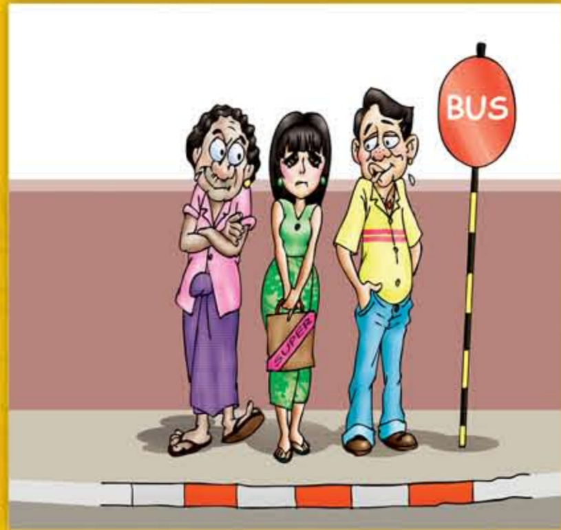
ပွမဗိုနကိုမတ် တကာ