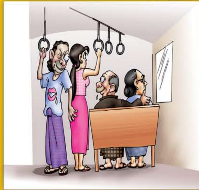
ပွမစုတ်လုက် ကုခန္ဓကာယ