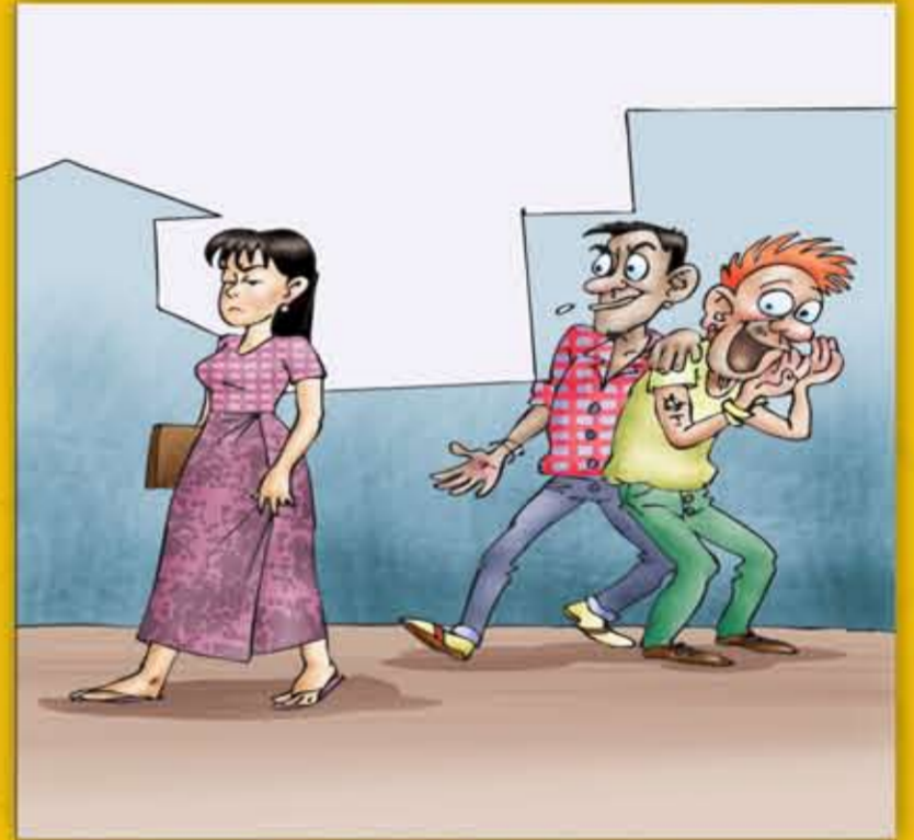
ပွမရံင်ကျောင်ခန္ဓတဲ ပပျက်ဂြိုင်စ-- ပွမ ဟရရရောင် စိုတ်နွံနွံ သွက်ဝံ ကောန်သွမ္မဲမ္မဲ ဟံမ္မဲကိုကျင်သီ