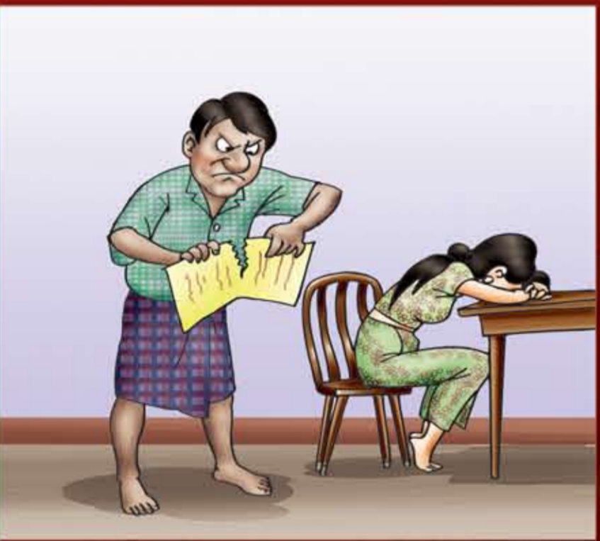
မကွာရှင်းပေးဘဲ ခြိမ်းခြောက်ခြင်း။