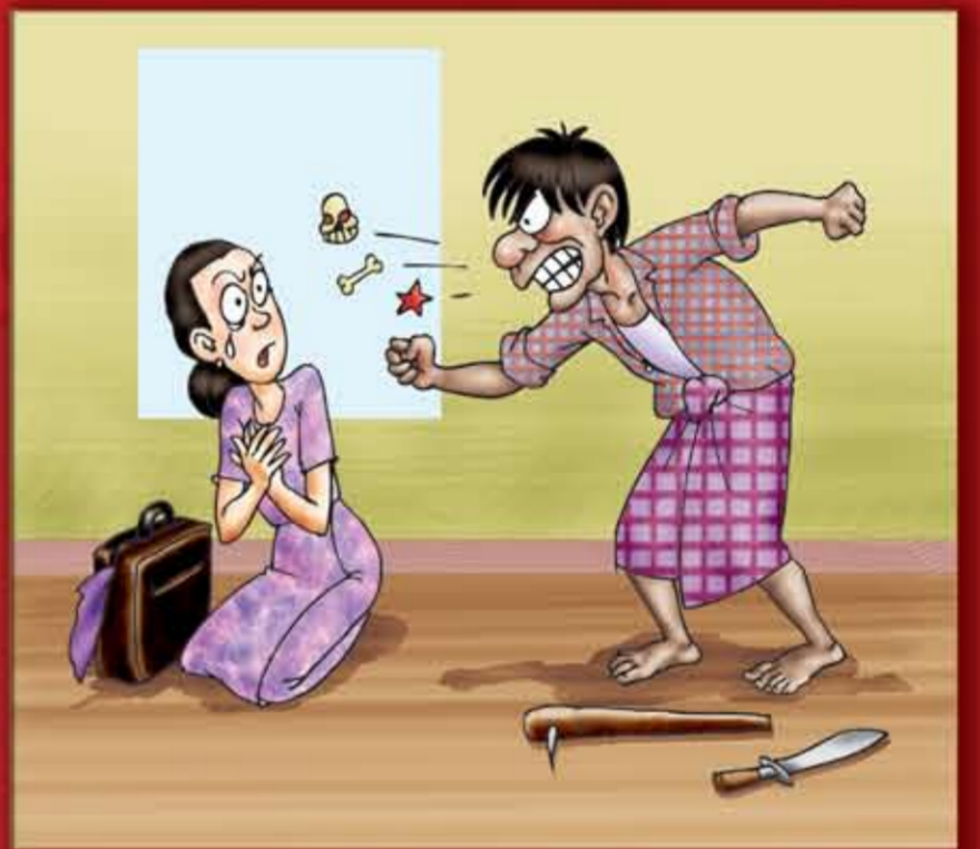
ရန်ရင်းကြမ်းတမ်းသော စကားများဖြင့် ချိုးနှိမ်ဆက်ဆံခြင်း။