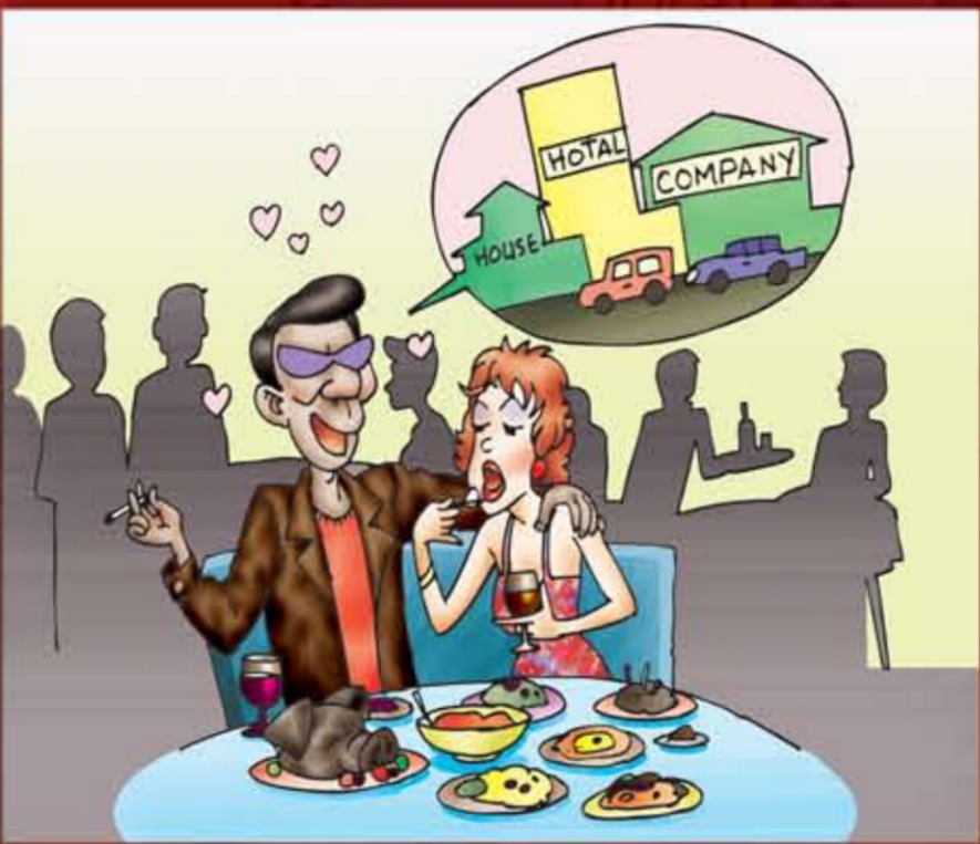
တိတ်တိတ်ပုန်းတွဲခြင်း နောက်အိမ်ထောင်ပြုခြင်း။