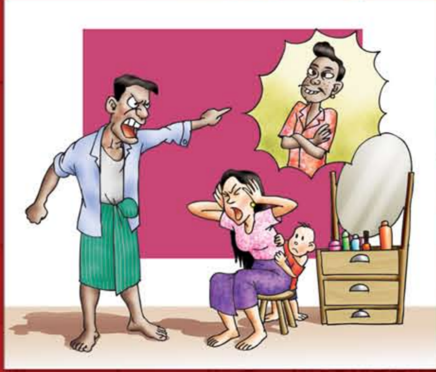
မဟုတ်မမှန်ဘဲ စွတ်ခွဲပြောဆိုခြင်း။