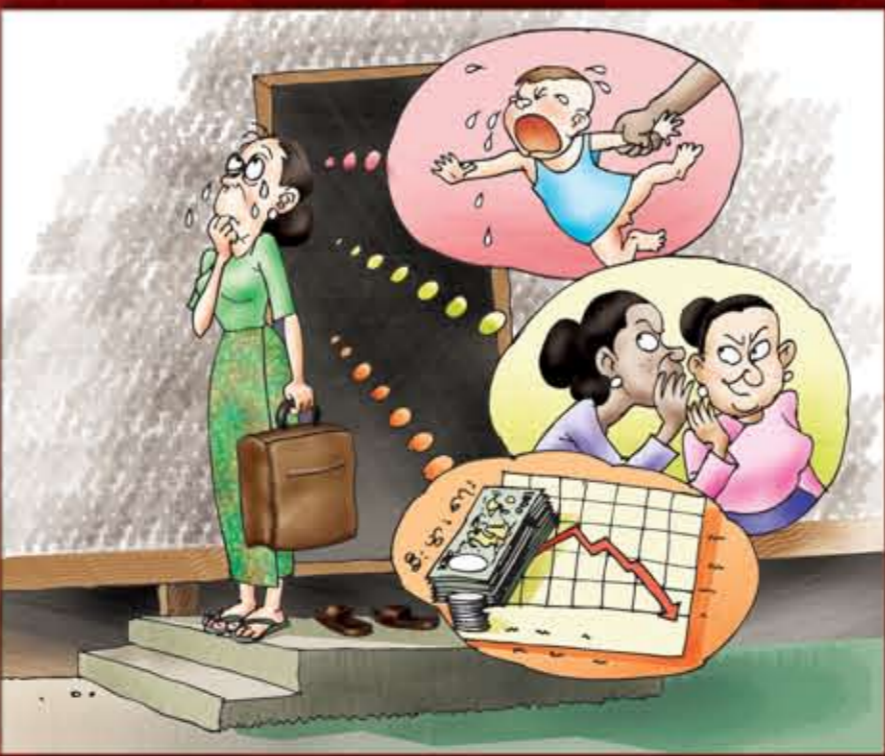
အကြမ်းဖက်ခံ ဇနီးမယားများမှ အိမ်ထောင်ကွဲရန် အလွန်ဝန်လေးကြောက်ရွံ့ခြင်း။