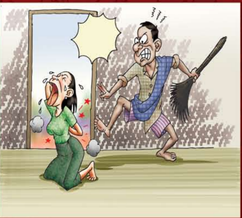
ရိုက်နှက်ခြင်း။