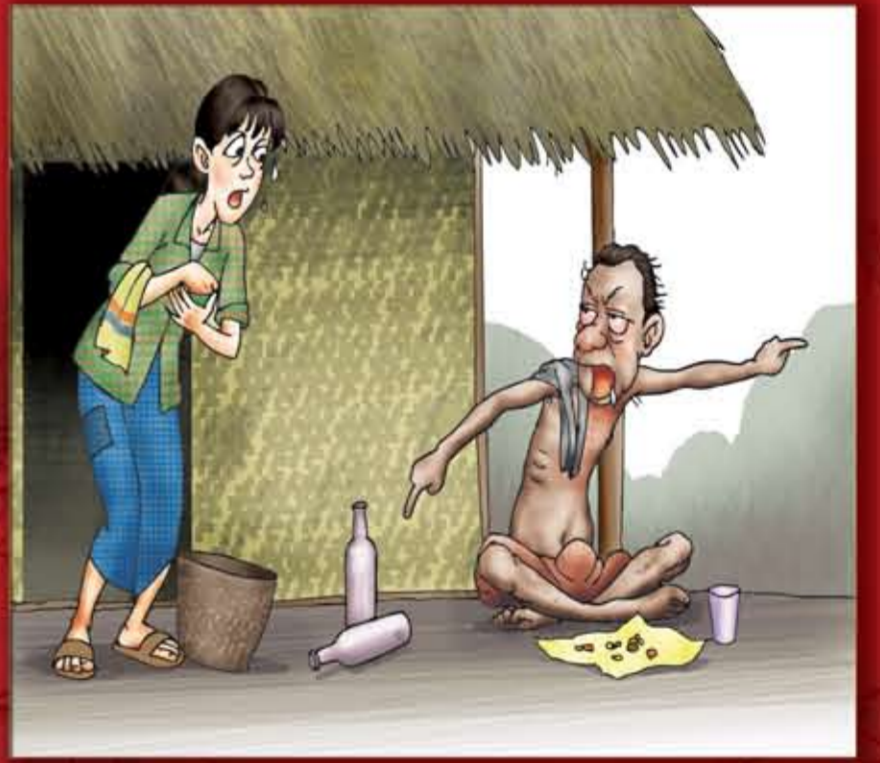
ဇနီး၏ဝင်ငွေဖြင့်သာ ရပ်တည်၍ သောက်စားပြန့်ပွားတီးခြင်း။