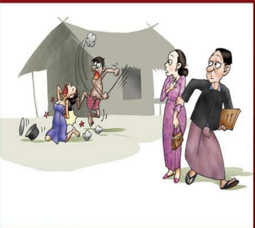
ပတ်ဝန်းကျင်မှ အိမ်တွင်းရေးဟုသာ ယူဆပြီး မပါဝင်လိုခြင်း။