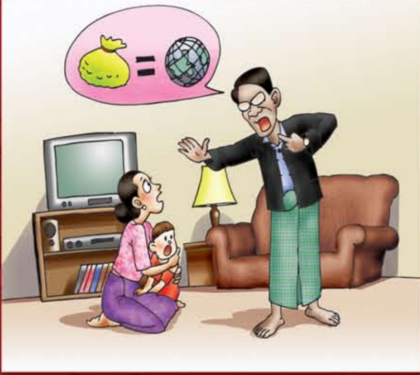
ဇနီးဖြစ်သူအား ပြင်ပဝင်ငွေရှာဖွေမှုကို ပိတ်ပင်ခြင်း။