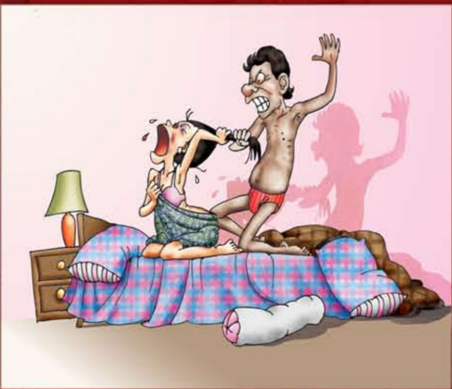
ညှင်းပမ်းနှိပ်စက်ပြီး လိင်ဆက်ဆံရန်ကြိုးစားခြင်း။