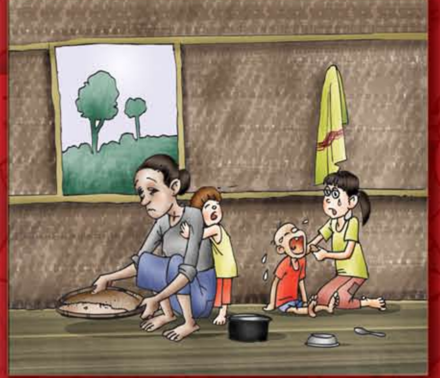
မိသားစုအား မထောက်ပံ့ခြင်း။